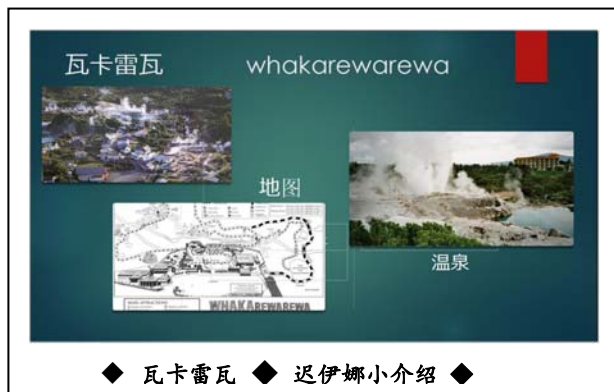
◆ 瓦卡雷瓦 ◆ 迟伊娜小介绍 ◆

后来, 我们的确找到了那只猫的主人, 同时也找到了我的小猫。最后这两只猫还成了好朋友了呢!