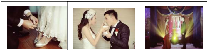
(图片说明: 我表姐的婚礼照片——穿鞋·吃汤圆·鞠躬)

最有趣的是: 当表姐的新郎和他的两个伴郎到她家门口接人时, 表姐和伴娘立刻躲进房间, 把房门关上, 不让新郎和他的两个伴郎进去。新郎为了能进到房间里去, 就把红包从门缝里塞进去了。伴娘拿了钱, 终于让新郎进房了。但在房间里, 伴娘还是挡住了新郎的路。新郎想要领走新娘, 还要回答问题。如果回答错误, 新郎就要发红包; 如果需要提示, 也要发红包; 如果回答不了或者失去了回答的机会, 就要受惩罚。我表姐夫在给了不少的红包后, 终于回答正确了, 伴娘一个个慢慢地让位, 直到新郎站到了表姐面前, 大家还不依不饶, 她们让新郎去找表姐的鞋子。其实新郎来之前, 伴娘已经把鞋藏好了。当新郎找到鞋时, 大家便一起呼喊, 要新郎帮新娘穿鞋。鞋穿好, 新娘高兴了, 两人就吃汤圆, 愿生活甜甜密密。折腾了半天, 新郎终于接走了我表姐, 他们的彩车浩浩荡荡开到了举行婚礼仪式的大酒店。表姐穿上了白色的婚纱, 漂亮得我都认不出来了, 庄重典雅的仪式结束后, 她又换了一身晚礼服来给亲友敬酒。酒足饭饱后, 客人便和新郎新娘合影, 想留下一份美好的回忆。