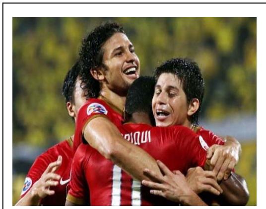
(图片说明: 精彩的足球比赛)

西班牙球队刚刚赢得了一场重要的比赛! 是世界杯足球赛! 赢得很辛苦所以他们开心地互相拥抱, 大笑起来。巴西足球队很羡慕, 周围喜欢西班牙球队的人也为他们感到高兴, 但那些讨厌他们的人都认为他们只是运气好, 实在不应该赢得这场重要的比赛!